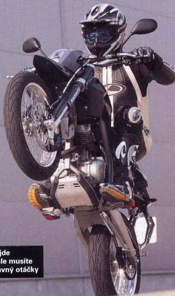
Na zadní jde fajnově, ale musíte trefit správný otáčky

Jakmile se vyhoupnu do celkem vysokého sedla, ihned se cítím líp než na podobných motorkách. Máte v něm totiž okamžitě pocit pevnosti a jistoty. Motorka si jenom lehce kecne, žádný potápění v tlumičích se tady nekoná. Neodpustím si zase srovnání s yamažím XT nebo XR125L od Hondy. Tohle jste, pánové, projeli na celé čáře, Blata je jiná liga. Motor při startu potřebuje lehce plynu, ale je ukrutná kosa, takže no problemo. V řídítkách, sedle a stupačkách cítíte lehké vibrace, které ale nejsou nijak nepříjemné a jsou naprosto srovnatelné s japonskou konkurencí. Byl tady i nápad dát motor do silentbloků, ale nakonec z toho